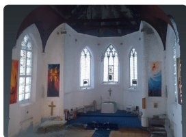
Культурный туризм и сохранение исторического наследия