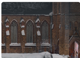
Архитектурные обмеры и обследования