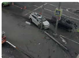
Документирование сложных ДТП и криминалистический анализ