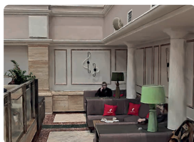
Дизайн интерьеров и реконструкция